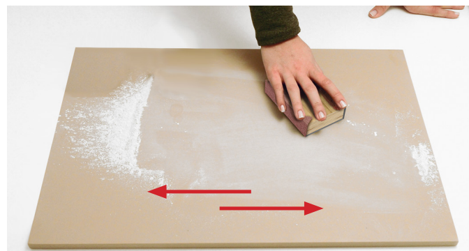
4. Usare il tampone (D) con carta Grana 240 (B) seguendo il senso indicato per ripristinare parzialmente la superficie