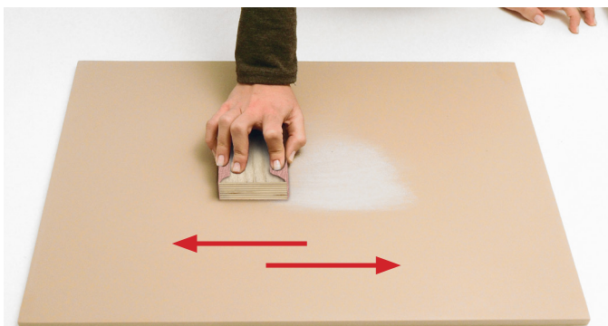
3. Strofinare seguendo il senso indicato con tampone (D) e carta Grana 180 (A) fino a rimuovere il graffio o la macchia