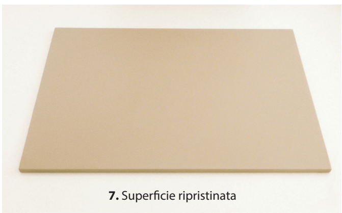
7. Superficie ripristinata