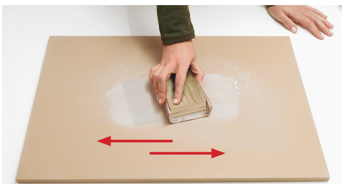
5. Strofinare con tampone (D) e carta Grana 320 (C) seguendo il senso indicato per ripristinare totalmente la superficie