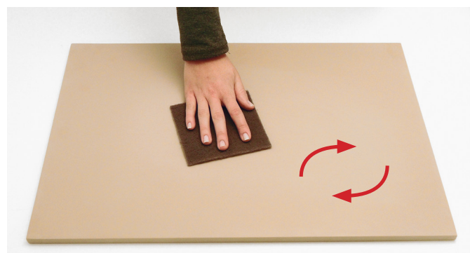
6. Strofinare l'intera superficie con scotch-brite (E) seguendo il senso indicato per satinare la superficie